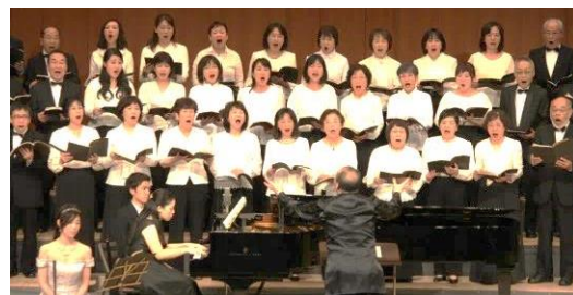
昨年のコンサートの様子（H28.12.22）

●応募締め切り／初級者：7月11日（火） 経験者（「第九」合唱をドイツ語で歌うコンサートに2回以上出演したことがある方）：10月10日（火）